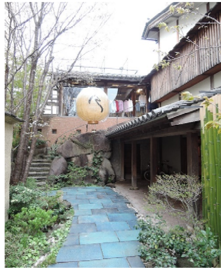
Badou-R本店 (東京都港区南青山)