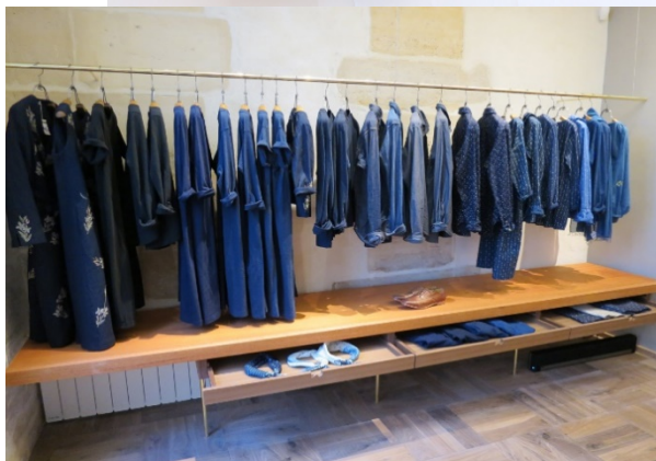
Paris Marais店 (パリ、フランス)