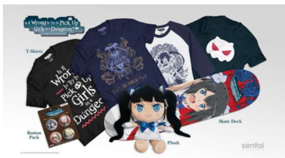
「ダンジョンに出会いを求めるのは間違っているだろうか」の関連グッズ