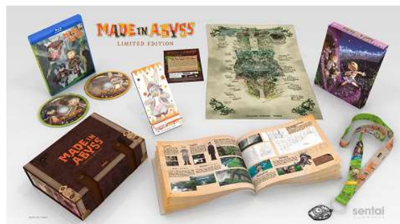
「メイドインアビス」の関連グッズ